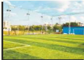
Artificial grass football turf