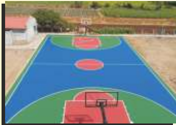
Acrylic Synthetic Flooring